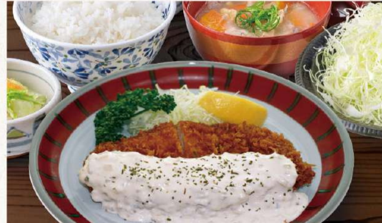
チキン南蛮定食 130g 1,450円(税込1,595円)