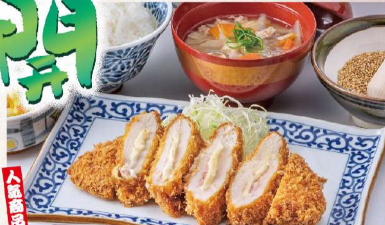
チキンチーズかつ定食 1,700円(税込1,870円) チキンにベーコン・チーズサンドの逸品!