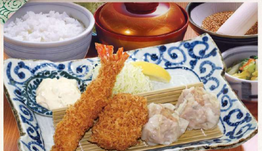
海老ヒレしゅうまい定食 1,700円(税込1,870円)